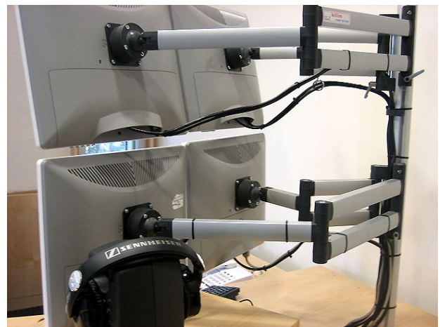
YT3241 + YT3230 (X4) + YT3245

Yellowtec m!kaシステムアームは、これまでにないすっきりとしたデザインで、サテライトスタジオなどの見せるスタジオやワンマンスタイルのミキサー周りに最適です。マイク、TFTモニターをシステムで構成できるので、テーブルの上をシンプルにまとめることができます。もちろん、マイクのみ、TFTモニターのみでの使用も可能なので、放送用のマイクとTFTを組み合わせたシステム以外にも、デスクのTFTモニターアームとしても使用が可能です。