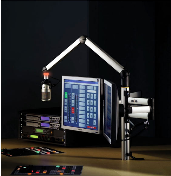
YT3205 + YT3241 + YT3230 (X2) + YT3245