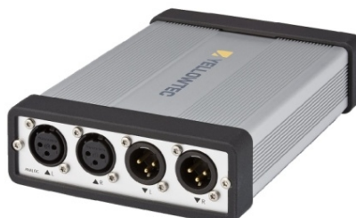
リアパネル(アナログ入出力コネクター)

PUC 2 はWindows, Macのプラグアンドプレイに対応したUSBオーディオコンバーターです。PCとの接続は特別なドライバなどを追加することなく、USBポートにつなぐだけで、Audioデバイスとして認識されます。